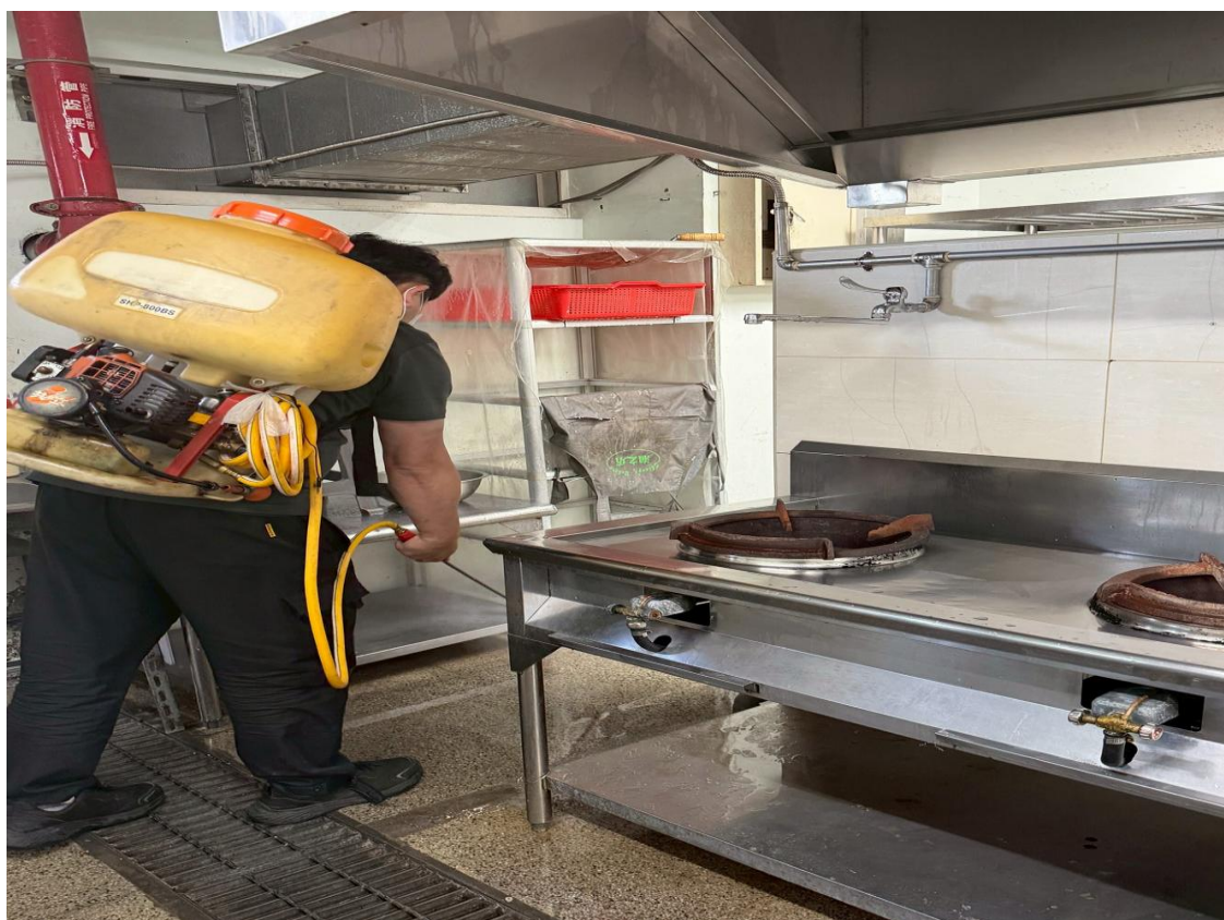
臺北商業大學(桃園校區)害蟲及鼠害驅治消毒工程相片 115.1.09