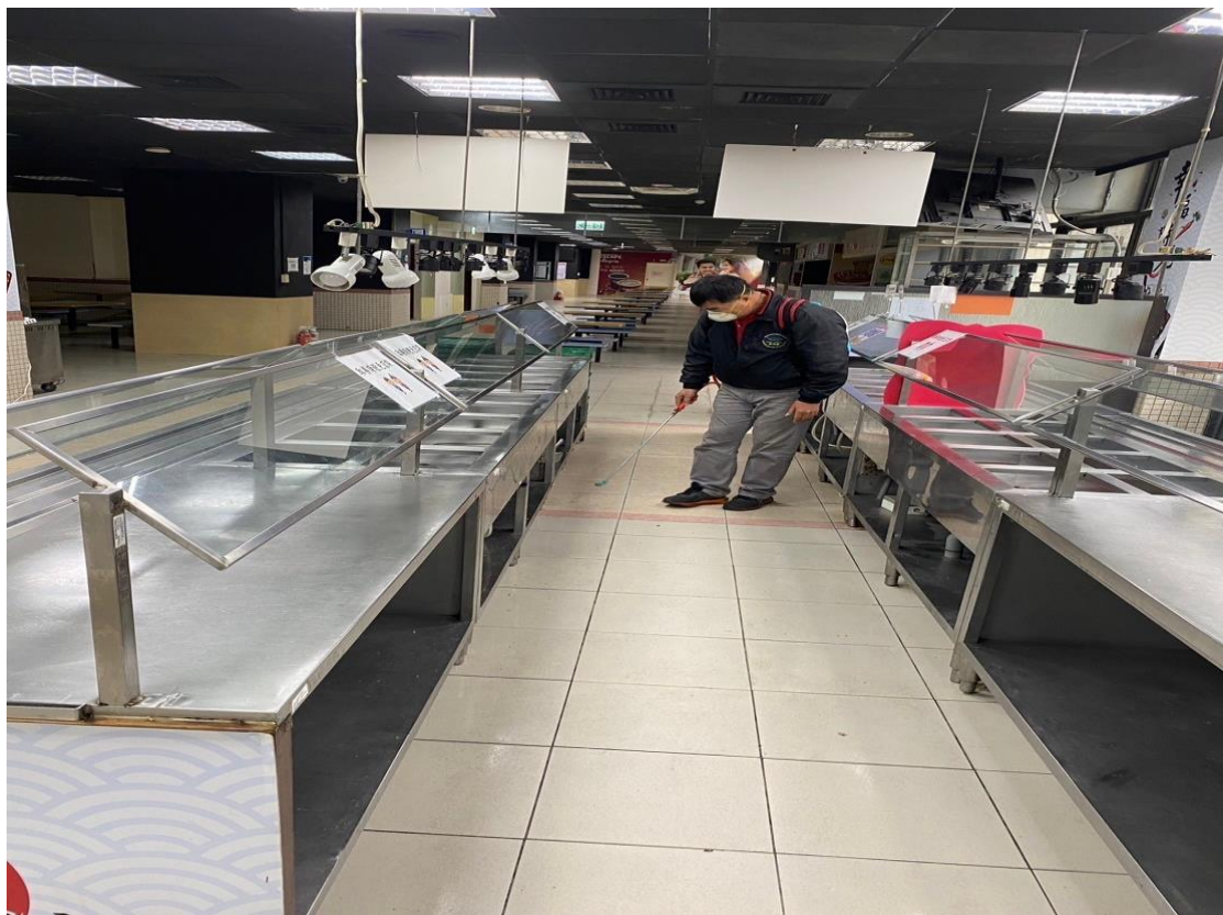
臺北商業大學 害蟲及鼠害驅治消毒工程相片 113.02.16